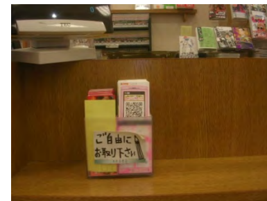
店頭でのしおり設置